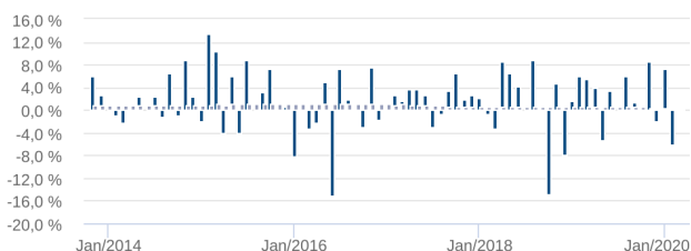
Retorno Mensal - 08/10/2013 a 22/04/2020 (mensal)