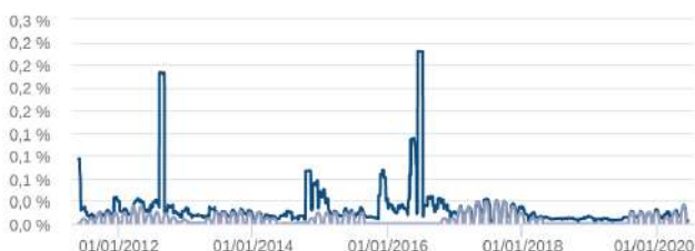
Volatilidade Anualizada - 29/04/2011 a 15/06/2020 (diária)