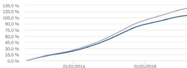
Retorno Acumulado - 29/04/2011 a 15/06/2020 (diária)