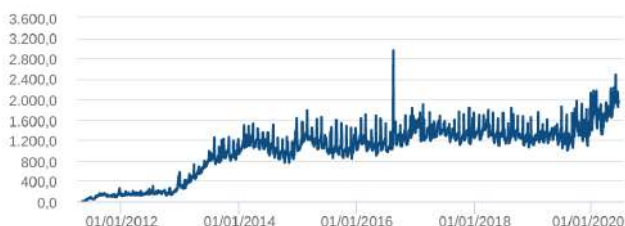
Patrimônio Líquido (R$ Milhões) - 29/04/2011 a 15/06/2020 (diária)