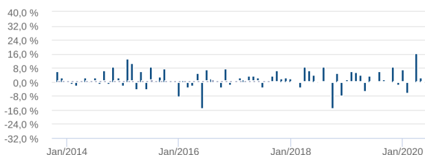
Retorno Mensal - 08/10/2013 a 17/06/2020 (mensal)