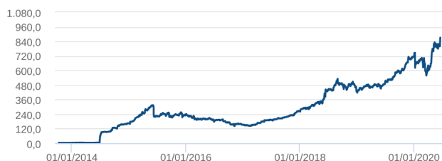
Patrimônio Líquido (R$ Milhões) - 08/10/2013 a 17/06/2020 (diária)