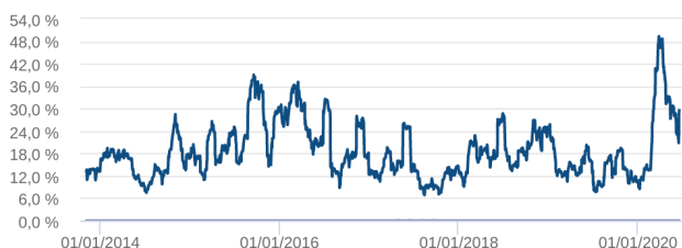
Volatilidade Anualizada - 08/10/2013 a 17/06/2020 (diária)