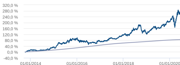
Retorno Acumulado - 08/10/2013 a 17/06/2020 (diária)