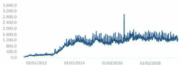
Patrimônio Líquido (R$ Milhões) - 29/04/2011 a 14/06/2019 (diária)