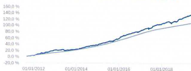
Retorno Acumulado - 08/09/2011 a 17/06/2019 (diária)