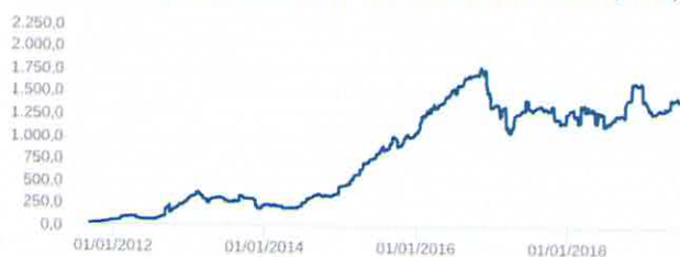
Patrimônio Líquido (R$ Milhões) - 08/09/2011 a 17/06/2019 (diária)