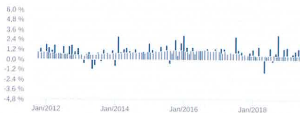
Retorno Mensal - 08/09/2011 a 17/06/2019 (mensal)