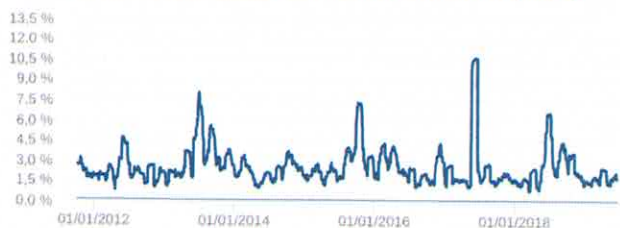
Volatilidade Anualizada - 08/09/2011 a 17/06/2019 (diária)