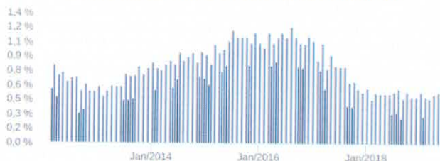
Retorno Mensal - 17/02/2012 a 27/06/2019 (mensal)