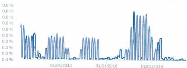
Volatilidade Anualizada - 17/02/2012 a 27/06/2019 (diária)