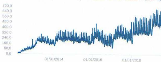
Patrimônio Líquido (R$ Milhões) - 17/02/2012 a 27/06/2019 (diária)