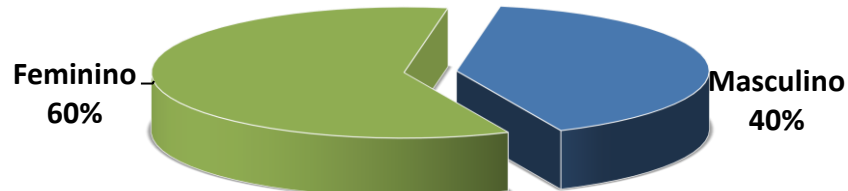
Gráfico 2 - Distribuição por sexo dos beneficiários expostos ao risco do SAÚDE-RECIFE - jan/2019 a dez/2019