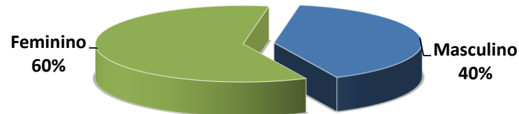
Gráfico 2 - Distribuição por sexo dos beneficiários expostos ao risco do SAÚDE-RECIFE - jan/2020 a dez/2020