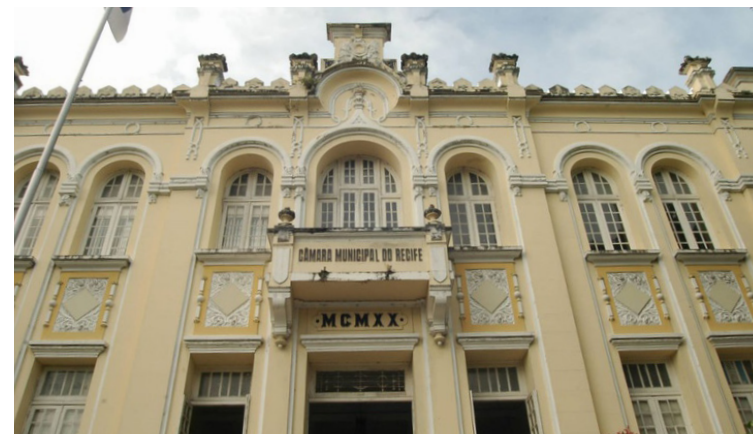
Semestre teve desempenho histórico do trabalho parlamentar

Também foi criada a Comissão de Igualdade Racial e Enfrentamento ao Racismo. Além disso, as demais Comissões se reuniram semanalmente, analisando projetos e deliberando sobre os mais diversos assuntos que impactam diretamente na vida cotidiana do povo recifense. No panorama atual provocado pela covid-19, foi reinstalada a Comissão Especial Interpartidária de Acompanhamento ao Coronavírus, que